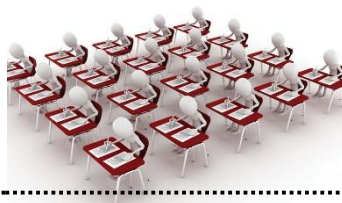
Схема расположения участников – по одному за партой. При этом в аудиториях присутствуют организаторы, не являющиеся преподавателями по данному учебному предмету

Диагностические работы проводятся в образовательных организациях по месту обучения участников